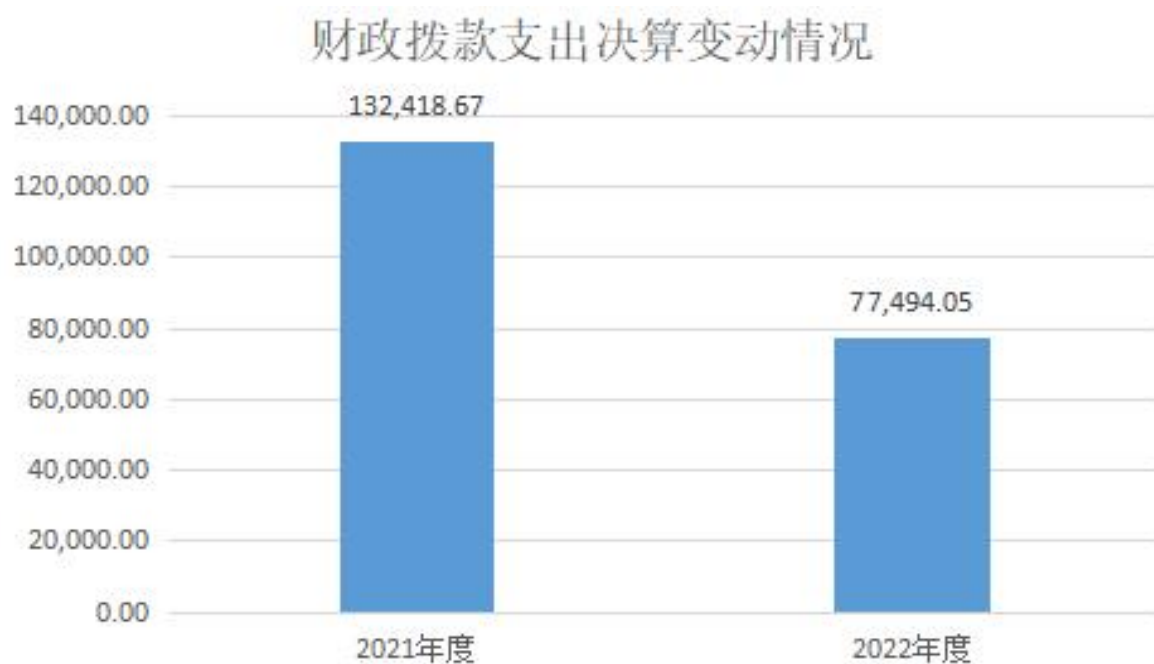
图 5：财政拨款支出决算变动情况（单位:万元）