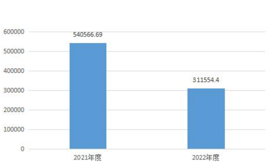
图 1：收、支决算总计变动情况（单位:万元）

2022 年度天津市消防救援总队收、支总计 311,554.40 万元，与 2021 年度相比，收、支总计减少 229,012.29 万元，下降 42.37%，主要是本年度地方财政采用零余额额度拨款及上年度补发补缴以前年度住房公积金。