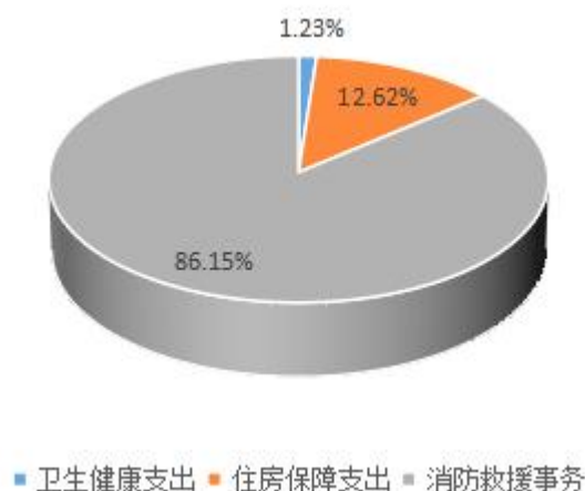
图 6：财政拨款支出决算结构